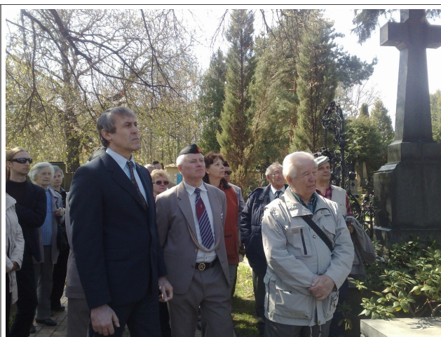
Zastávka na hřbitově.