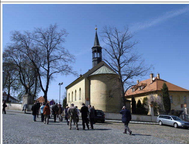
Cesta vedla také kolem hostivařského kostela Stětí sv. Jana Křtitele, kde jsme měli možnost prohlédnout fresky z doby posledních Přemyslovců.