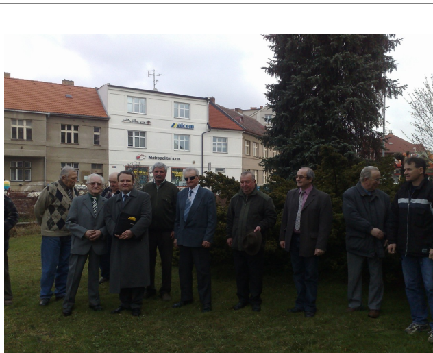
Havlíčkův Brod, 14.4.2010