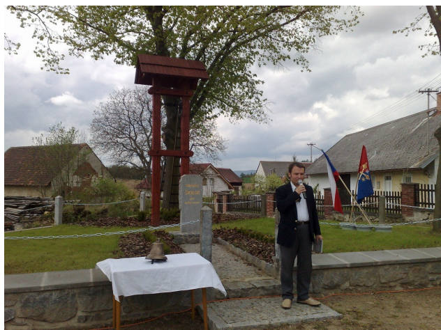
Bolešiny (Klatovsko), 1.5.2010