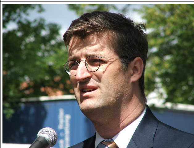
Poslanec Evropského parlamentu Mgr. Hynek Fajmon.