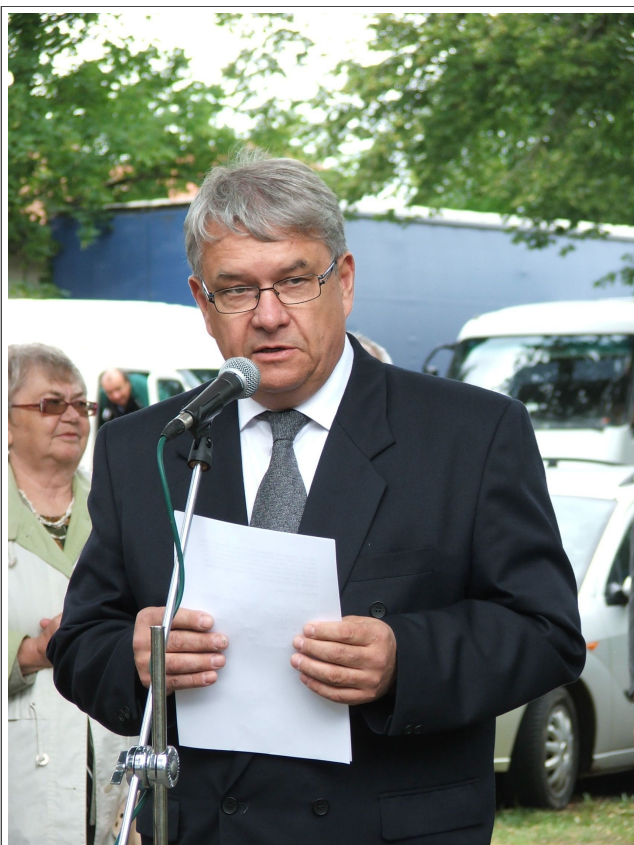
Hostitel celé akce starosta města Kožlany Mgr. Vladimír Příbyl.