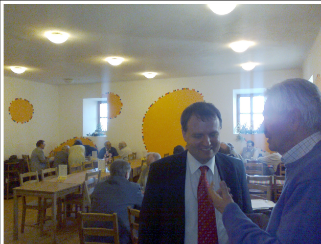
Z posezení v Toulcově dvoře.