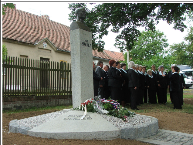
Znovuobnovená socha Antonína Švehly.