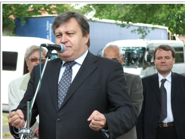
Poslanec PSP ČR za plzeňský kraj Ing. Vladislav Vilímc.