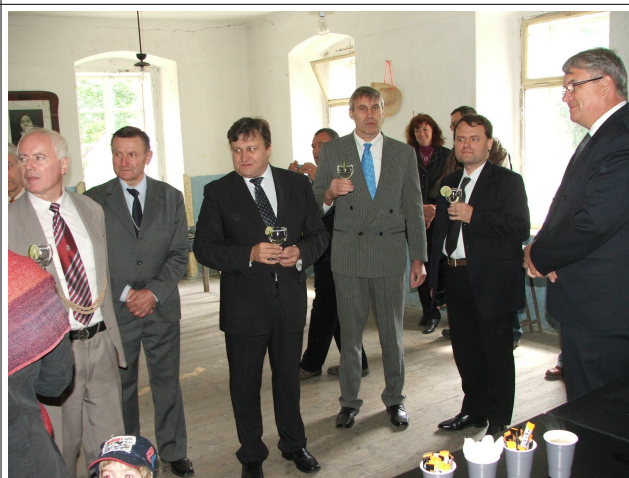
Ze slavnostního připitku.