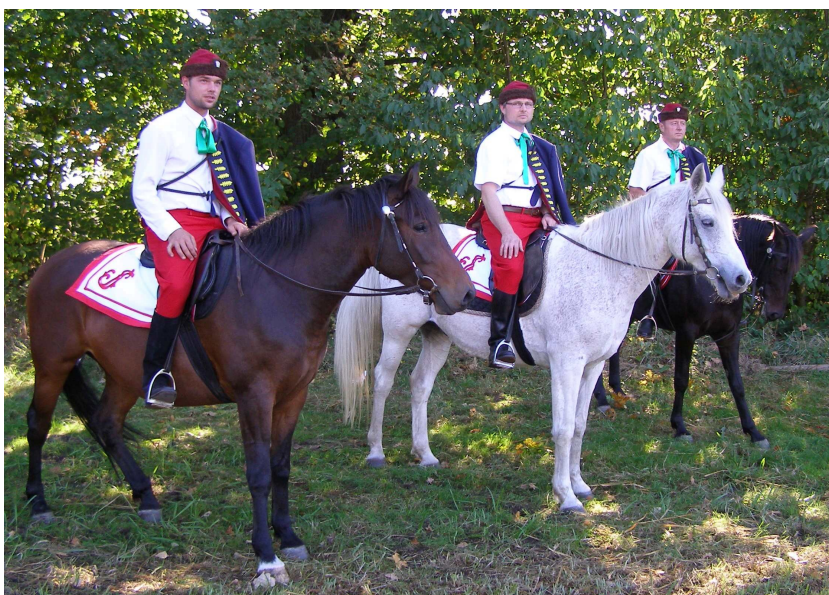
Foto: část SJ na první přehlídce ve Štěkni dne 1.10.2011