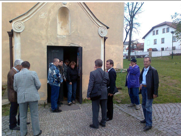
Krátké zastavení u kostela Stětí sv. Jana Křtitele.