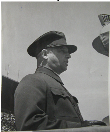
Zborovské slavnosti 1937.