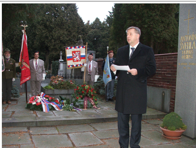
Ministr zemědělství Ing. Petr Bendl.