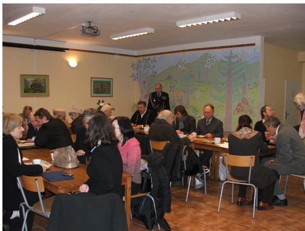
Z posezení v Toulcově dvoře.