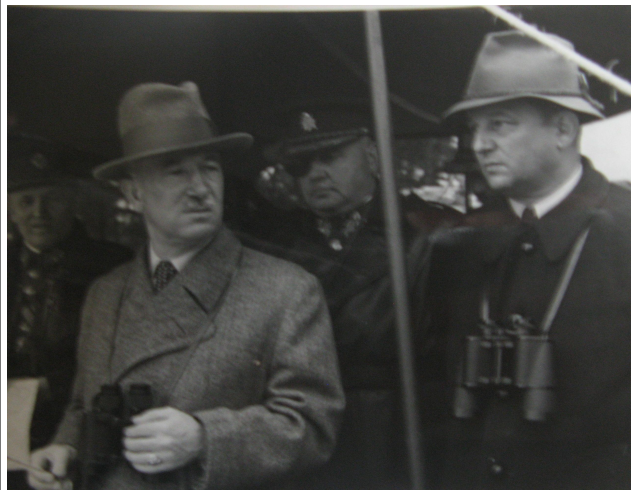
S prezidentem Edvardem Benešem.