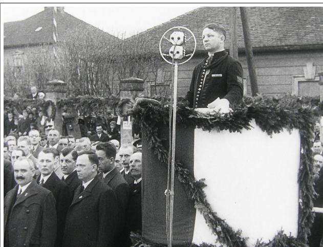
Projev při odhalování sochy Antonína Švehly v Klatovech.