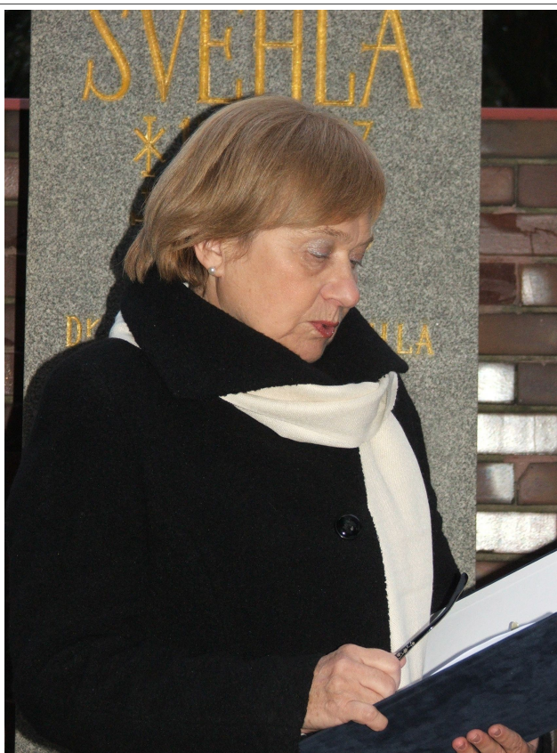
Z vystoupení místopředsedkyně Senátu PČR RNDr. Aleny Palečkové.